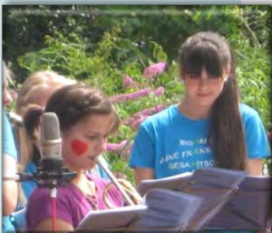
30. November 2014